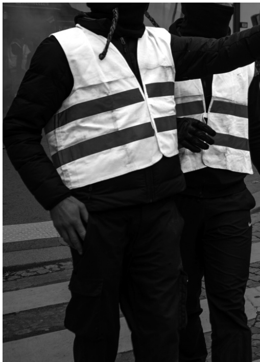
ville lumière samedi noir | jauni hallyday va tout brûler | 2019 : que de

18. Elles sont une petite dizaine et déambulent joyeusement dans la rue de Rivoli. Certaines se tiennent par la main, d'autres sautent comme des cabris, elles entonnent des chansons bricolées pour l'occasion. « Lgbt », « Gouines en colère », « Femmes en lutte », leurs gilets sont aussi fleuris que leurs messages diffusés au mégaphone. Leur enthousiasme se répand. Autour ça regarde avec douceur, ça rigole et ça chante.