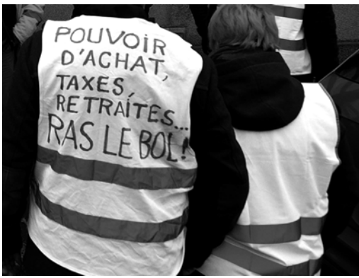
Imacron fais comme nous : taxe tes potes | noëi n'aura pas lieu | on veut + de samedi

14 juillet 1789: des casseurs saccagent: un monument historique