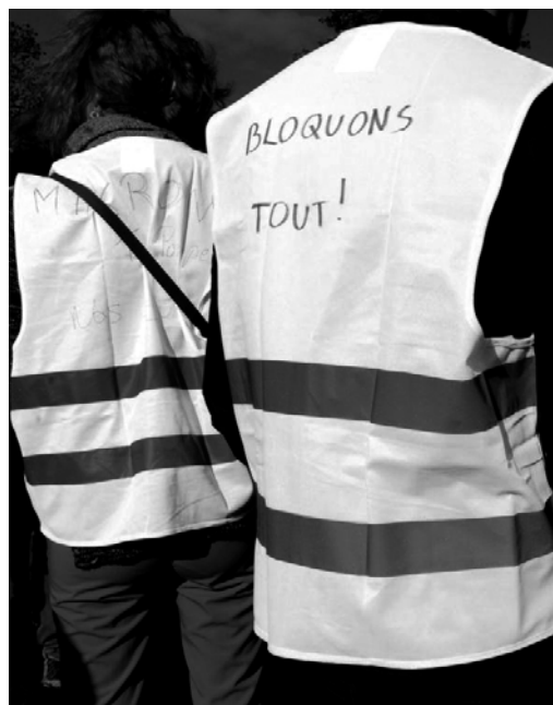
enfin les ronds points servent à quelques chose | mets ton gilet.

9. Une barricade est en train de se monter avenue George-V avec les jardinières renversées d'un grand hôtel, un hôtel de luxe, qui a précautionneusement baissé ses rideaux de fer. Quelques véhicules brûlent un peu plus loin et des clubs de golf dérobés, dans un magasin de luxe aussi, circulent de main en main. Deux femmes de ménage, en tenues noires réglementaires, avec collerettes de dentelle, passent la tête à une fenêtre de l'hôtel, de luxe toujours. Elles donnent des signes d'encouragement à la multitude luxuriante dans la rue, qui les acclame. Un autre jour, les conducteurs de métro en font tout autant : rame après rame, ils klaxonnent pour saluer les lycéens qui défilent en contrebas, boulevard de la Villette, en dessous du métro aérien. Ce qui est en bas est comme ce qui est en haut. Et ce qui est en haut est comme ce qui est en bas, pour réaliser les miracles d'une seule chose.