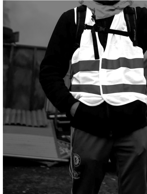
le joli jaune des gilets gêne | fin du monde, fin du mois, même coupable, même combat | phase 1: les champs élysées; phase 2: le monde | les gilets jaunes triompheront | prépare tes valises pour jupiter, on s'occupe de tout

Cécile Carbonel est comédienne Alexandre Pierrepont est anthropologue